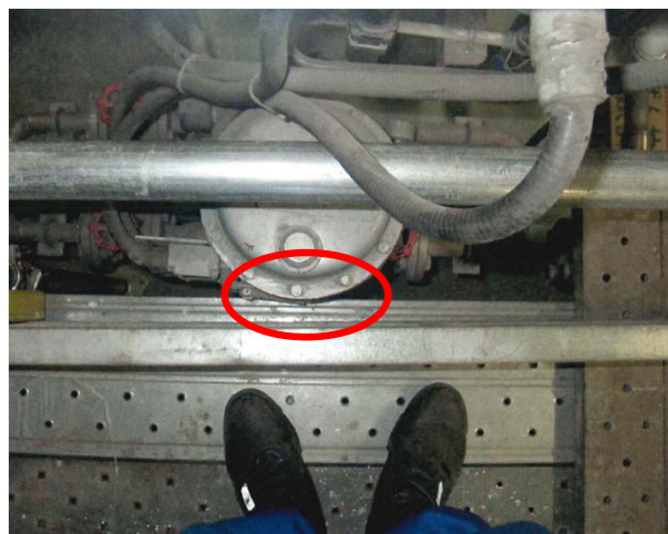
上方より見た状況